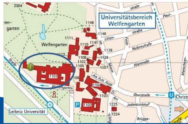
Kartographische Bearbeitung: Institut für Kartographie und Geoinformatik*

https://www.uni-hannover.de/de/service/wegweiser/anfahrtsbeschreibung/